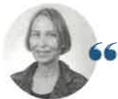
Nathalie MASSIAS Présidente de la cour administrative d'appel de Douai

Après une année 2020 fortement affectée par la situation sanitaire, l'année 2021 a été marquée par une augmentation de plus de 35 % des recours enregistrés, particulièrement dans les contentieux des étrangers (52 %), de la fiscalité (9 %) et de la fonction publique (9 %). Après la forte diminution du nombre d'affaires enregistrées en 2020, cette hausse traduit un retour au niveau d'activité de l'année 2019 avec 2 631 affaires jugées par la juridiction, soit 2,5 % de plus qu'en 2020. Malgré cette hausse, la cour a maintenu des délais de jugement équivalents à 2020 (9 mois et 11 jours), toujours inférieurs à la moyenne nationale.